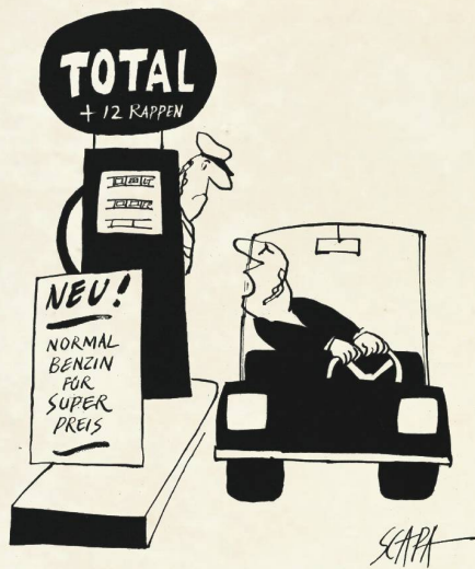
«Ihr seid ja total verrückt ...»