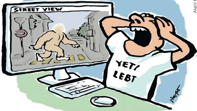
BEINAHE HÄTTE STREET VIEW DIE EXISTENZ DES YETI BEWIESEN.