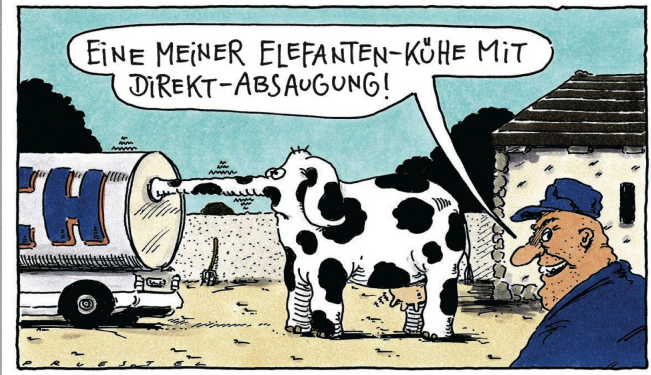
Hoch spezialisierte Landwirtschaft