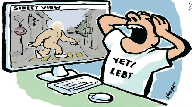
BEINAHE HÄTTE STREET VIEW DIE EXISTENZ DES YETI BEWIESEN.