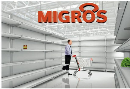
Das neue Logo im übersichtlichen Ladenkonzept.