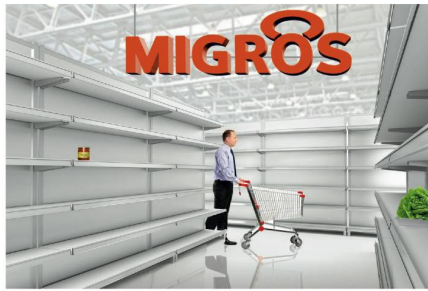
Das neue Logo im übersichtlichen Ladenkonzept.