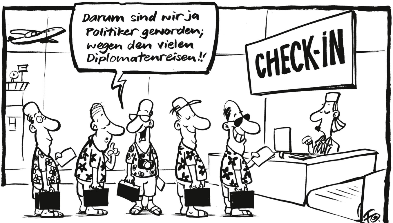
Schweizer Parlamentarier unternehmen immer häufiger Diplomatenreisen . Für die «Internationale Beziehungspflege» wurde deshalb eine Erhöhung des Budgets auf 500 000 Franken beantragt.