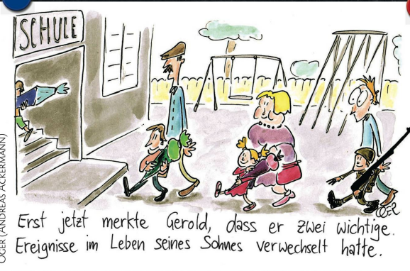
OGER (ANDREAS ACKERMANN)