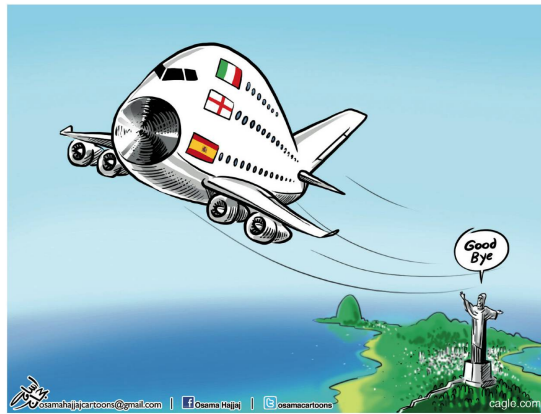
Osama Hajjaj | Jordanien Darüber lacht die ganze Welt: WM-Ausscheiden der Top-Favoriten