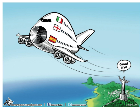
Osama Hajjaj | Jordanien Darüber lacht die ganze Welt: WM-Ausscheiden der Top-Favoriten