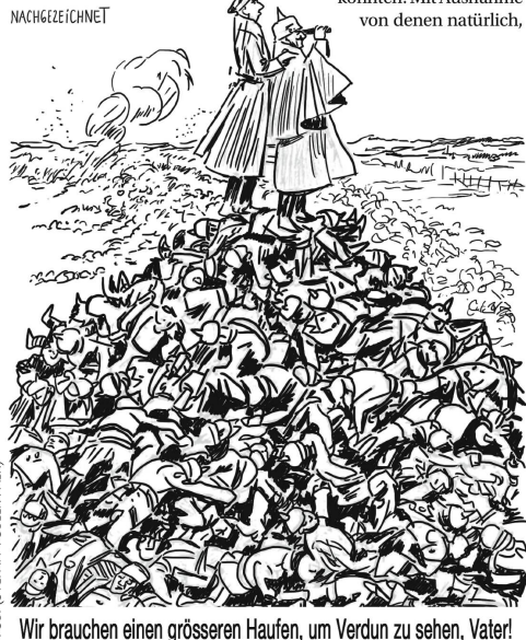
TOBLER (STEFAN TOBLER FALK)

Wir brauchen einen grösseren Haufen, um Verdun zu sehen, Vater!