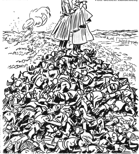
TOBLER (STEFAN TOBLER FALK)

Wir brauchen einen grösseren Haufen, um Verdun zu sehen, Vater!