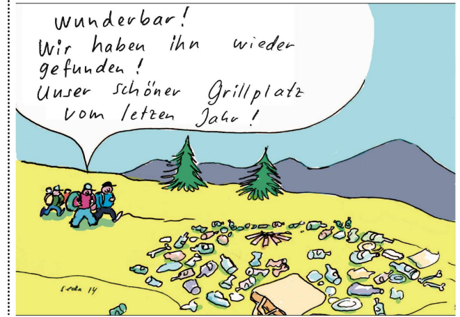
SEDA (CHRISTOF SONDEREGGER)