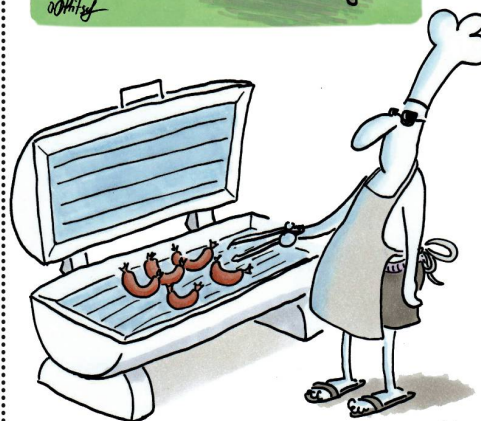
GRILLEN IM WINTER