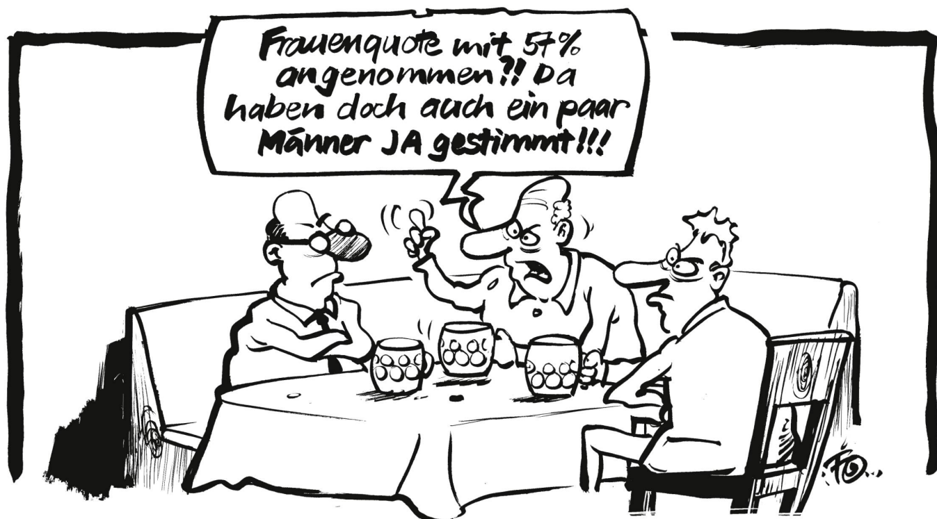
Geschlechterquote auf dem Vormarsch: Als erster Kanton der Schweiz führt Basel eine Frauenquote von mindestens einem Drittel in Verwaltungsräte staatlicher und staatsnaher Betriebe ein.