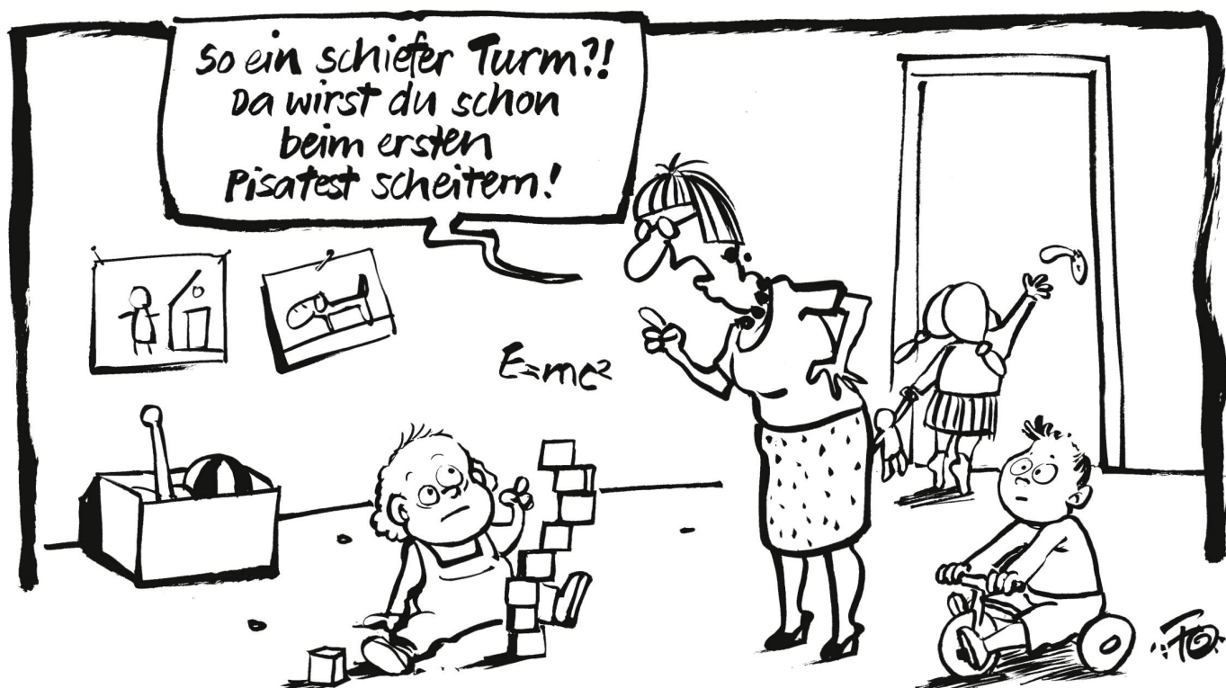
Der Einstufungs- und Messwahn im Schulsystem nimmt derart zu, dass teils bereits im Kindergarten Lernberichte erstellt werden. Basler Chindsgi-Lehrpersonen etwa bewerten Leistung und Verhalten der Kleinen auf einer Fünferskala.