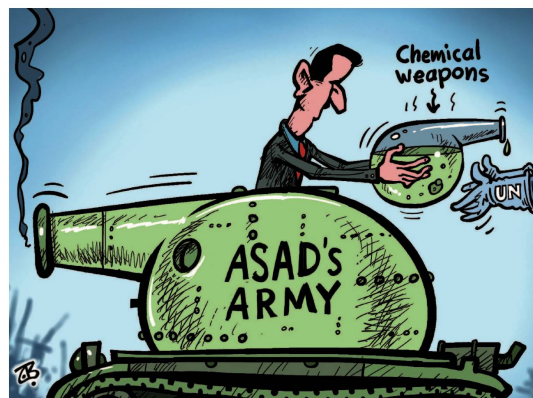
Emad Hajjaj | Jordanien Assads chemische Waffen