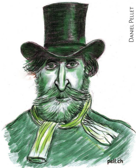
Undatiertes Porträt des grossen Giuseppe Verdi, als dieser sich einmal grün geärgert hatte.

G iuseppina hiess seine zweite Frau: G+G wie heute für Glanz und Gloria.