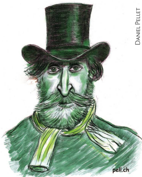
Undatiertes Porträt des grossen Giuseppe Verdi, als dieser sich einmal grün geärgert hatte.

G iuseppina hiess seine zweite Frau: G+G wie heute für Glanz und Gloria.