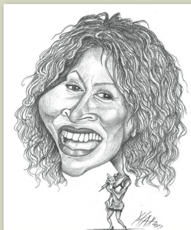
Tina Turner , feiert in Küsnacht (ZH) eine Hochzeit, über die die ganze Welt spricht. Zumindest bis «Täschligate».