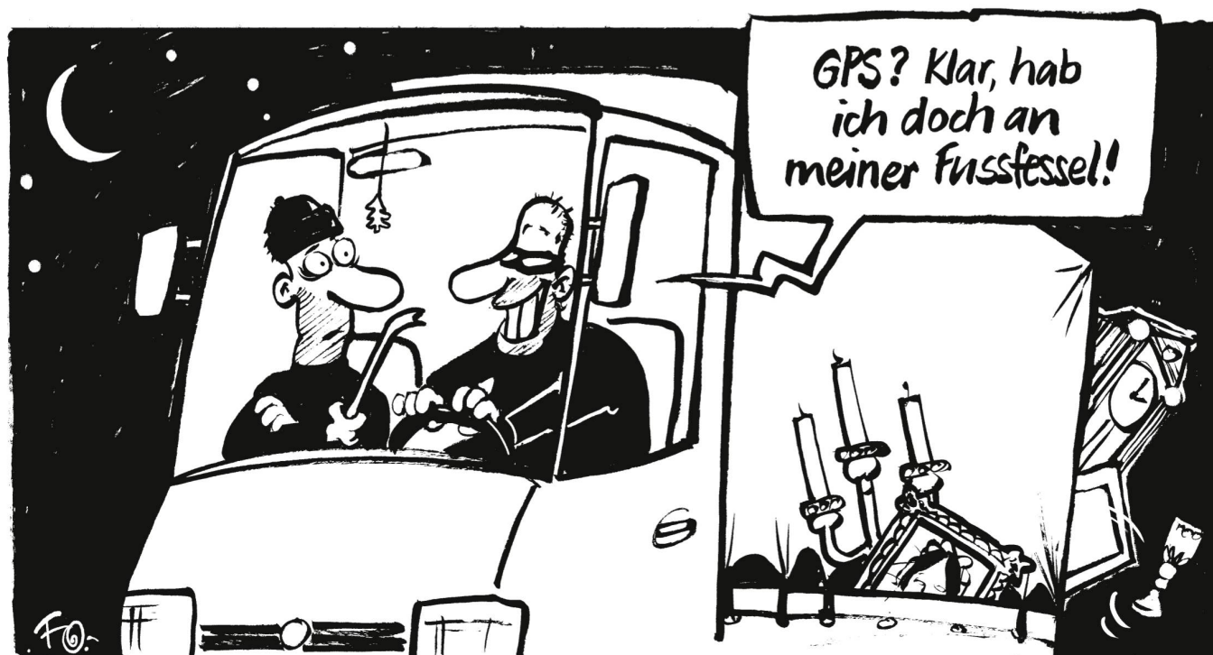
Straftaten lassen sich durch Fussfesseln nicht verhindern. Durch einen schweizweiten Einsatz von Fussfesseln mit GPS sollen aber rückfällige Straftäter überführt werden.