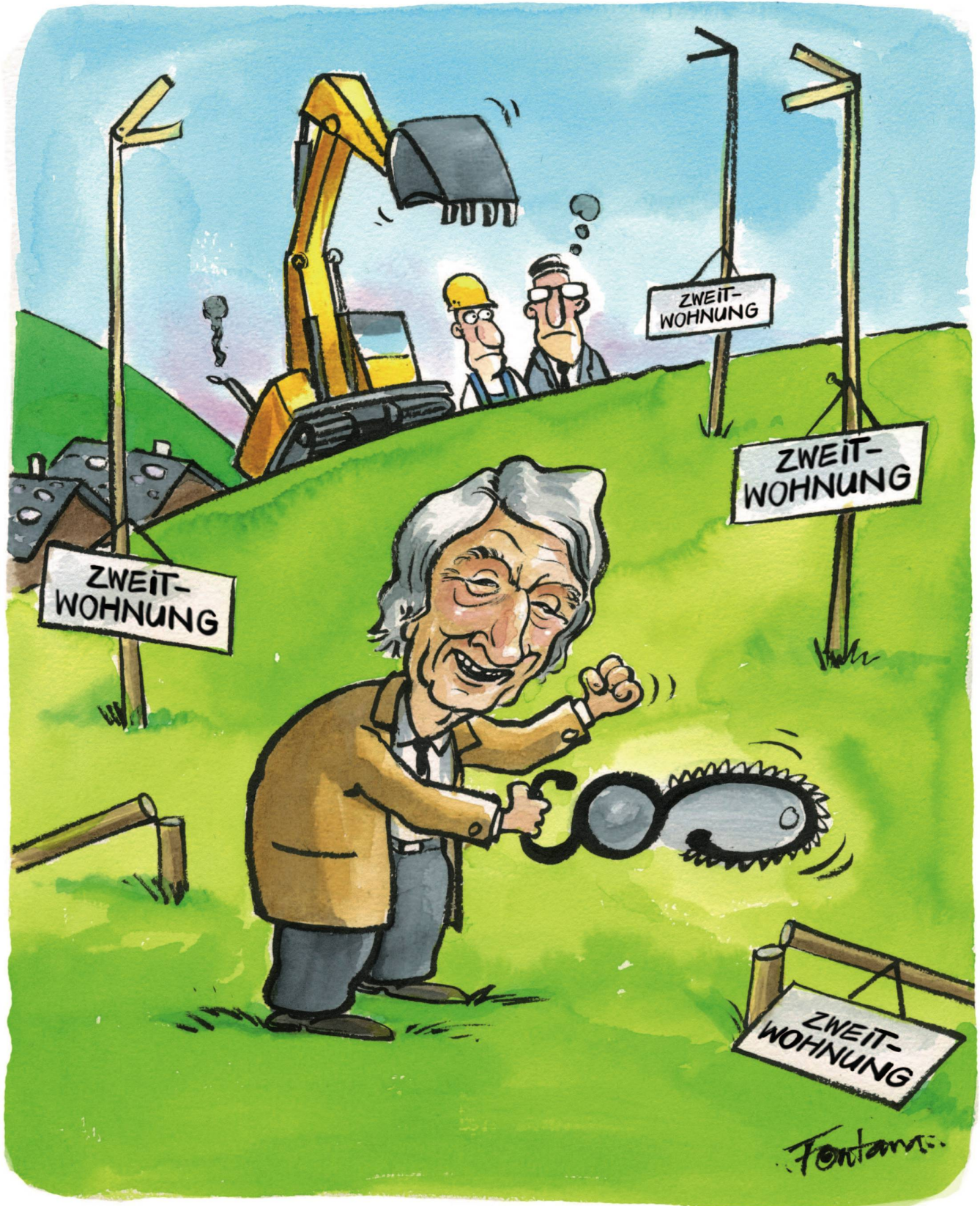
Die von Umweltschützer Franz Weber lancierte und am 11. März 2012 angenommene Zweitwohnungs-Initiative gilt laut Bundesgerichtsentscheid seit dem Abstimmungssonntag.