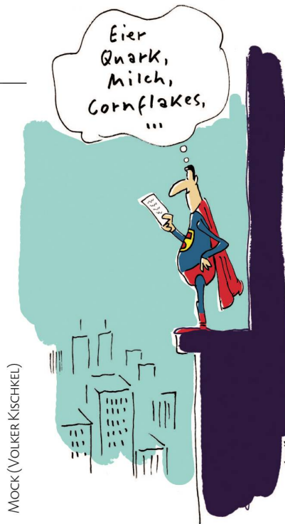
MOCK (VOLKER KISCHKEL)

Die Ära der Helden ist passee. Wir leben im Zeitalter der Tycoons.