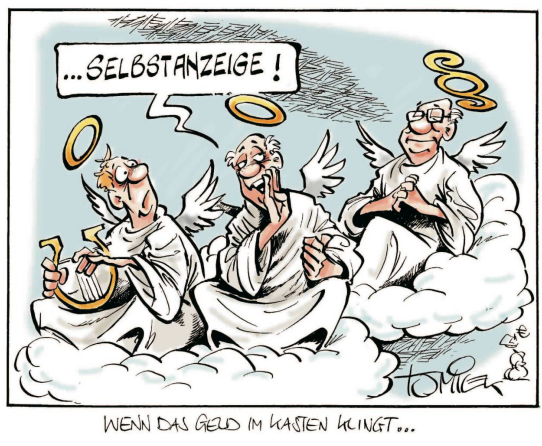
Jürgen Tomicek, Deutschland Selbstanzeigen und Scheinheilige Luojie, China Spaniens Arbeitslosenquote.