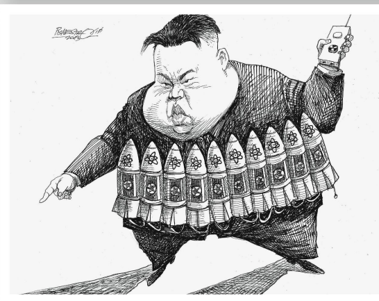
Petar Pismestrovic Österreich