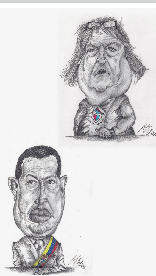
Nebelspäter Nr. 4 | 2013