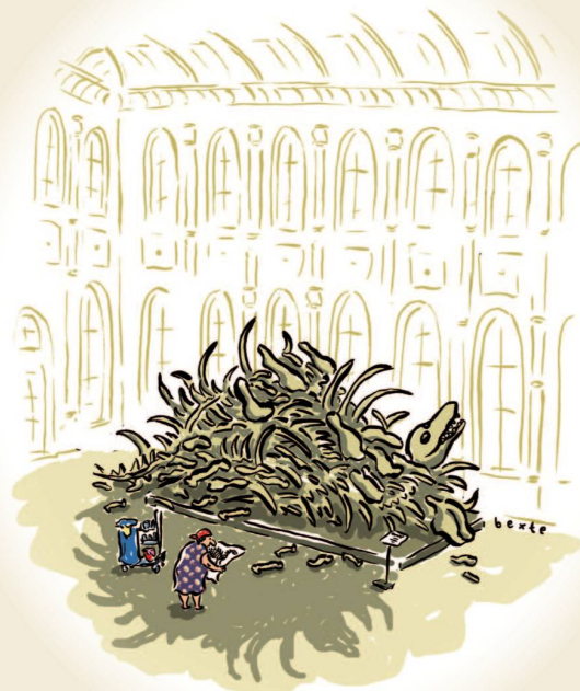
Fluch der Aknibik 2