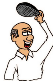
... meine Haare aber auch!