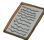
Das gute alte Waschbrett!