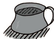
Der gute alte Nachttopf!