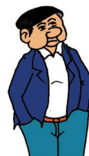
... der Waschbrettbauch!