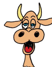
Kühe mit Hörnern!