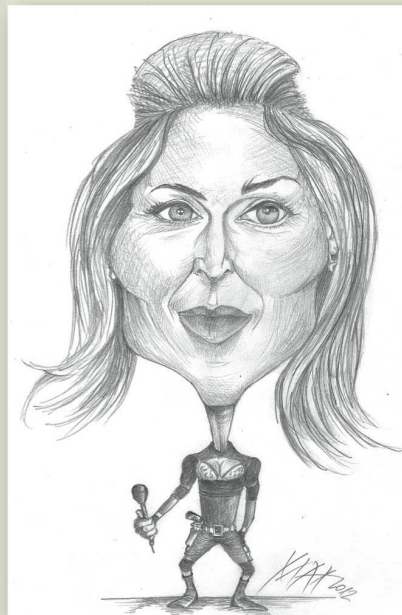
Verbissen jung geblieben: Madonna