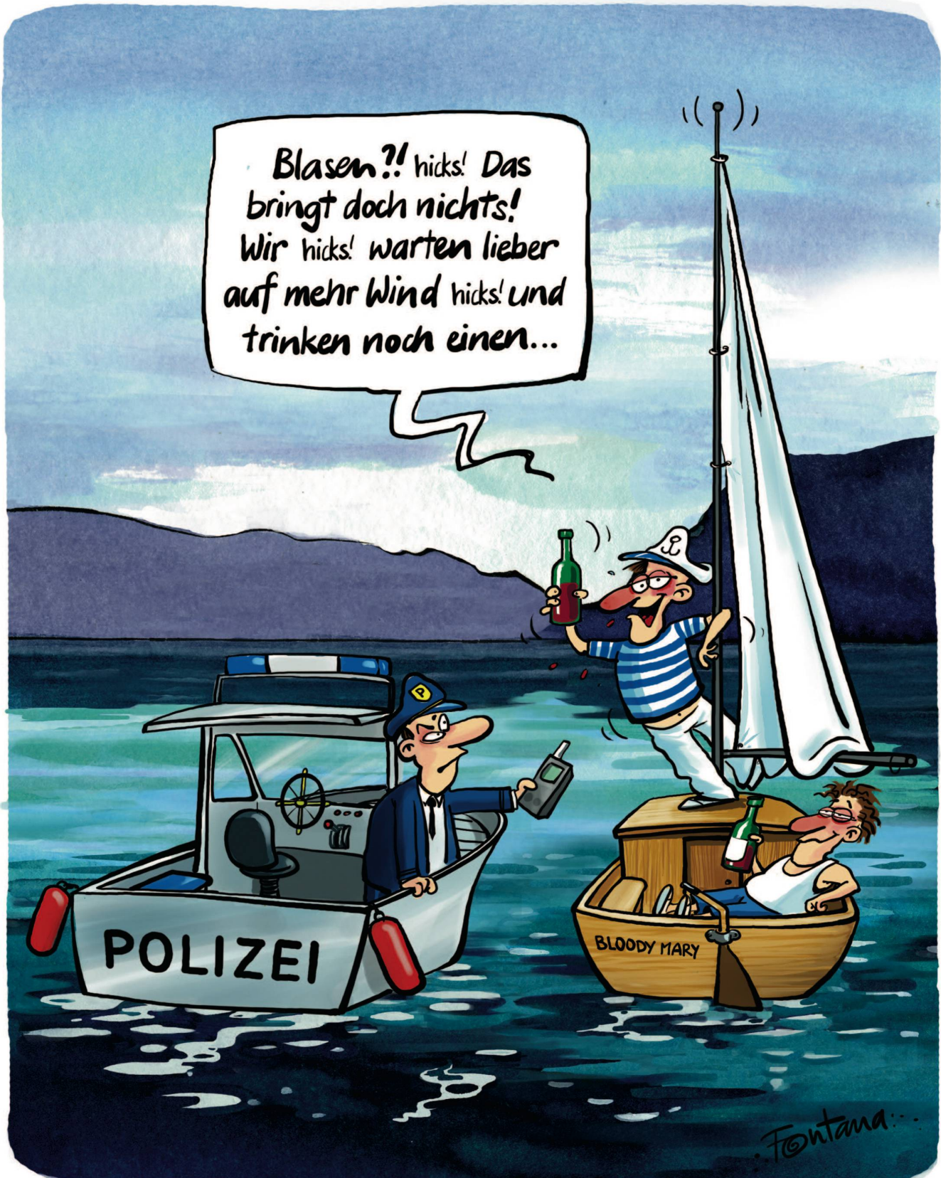
Ab Sommer 2013 will der Bundesrat eine Promillegrenze für Freizeitkapitäne festlegen. Bisher ist saufen an Bord erlaubt.