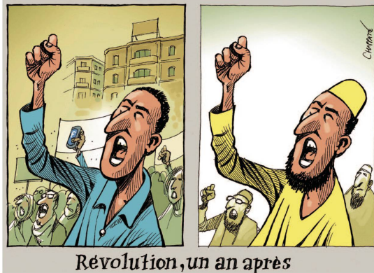
Patrick Chappatte, Le Temps, Genf