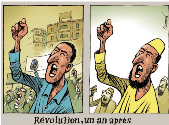
Patrick Chappatte, Le Temps, Genf