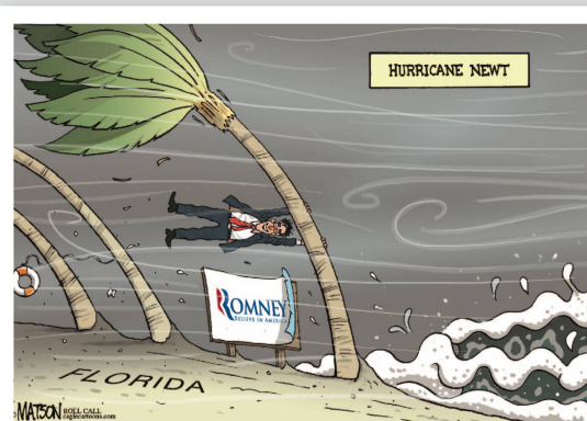
R. J. Matson | St. Louis, USA Republikaner: Mitt Romney und der Hurrikan.