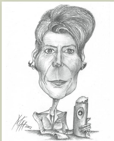
Vom linken Mainstream verehrte Hardlinerin: Keller-Sutter