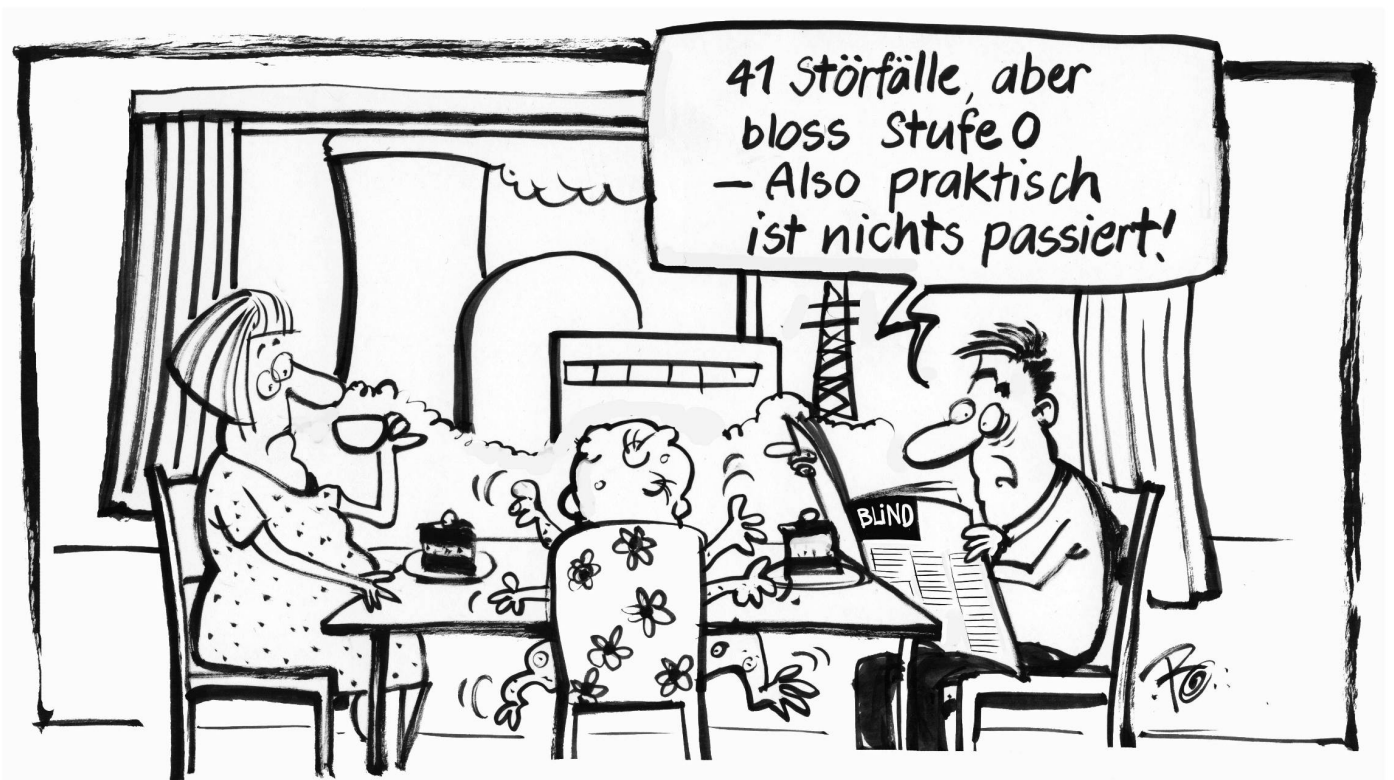
Das Eidgenössische Nuklearsicherheitsinspektorat registrierte 2010 insgesamt 42 meldepflichtige Störfälle in Schweizer AKW – davon eine Störung der Stufe 2 ...