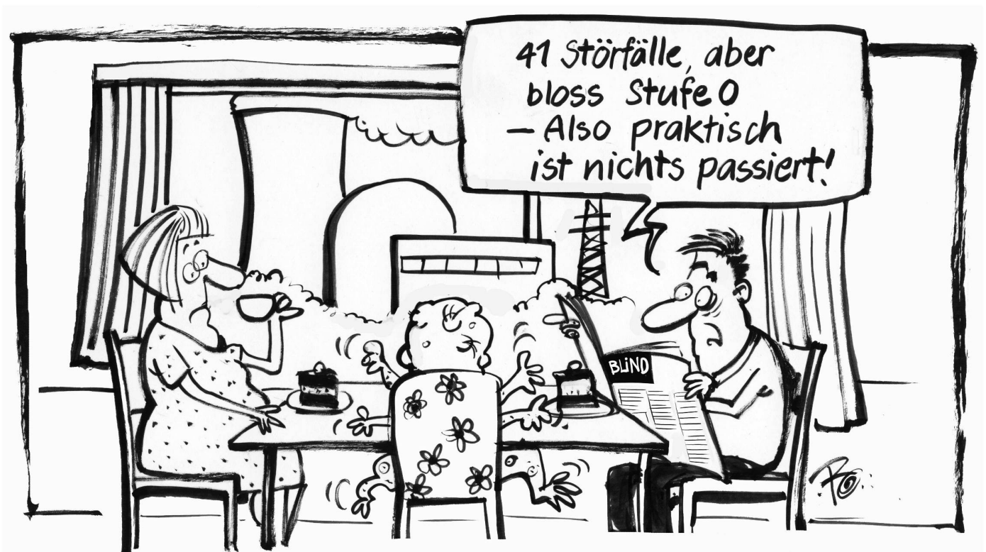
Das Eidgenössische Nuklearsicherheitsinspektorat registrierte 2010 insgesamt 42 meldepflichtige Störfälle in Schweizer AKW – davon eine Störung der Stufe 2 ...