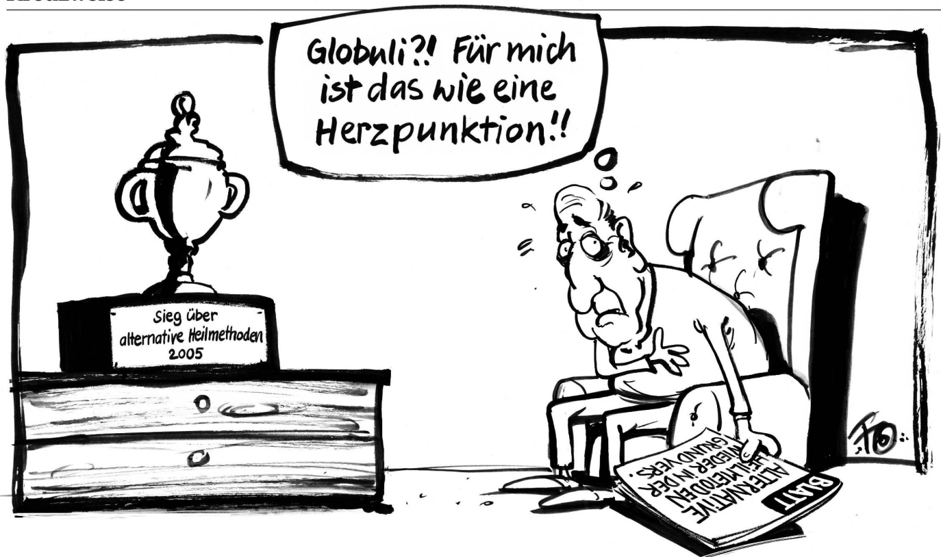
Im Jahr 2005 kippte Pascal Couchepin die Komplementärmedizin aus der Grundversicherung. Sein Nachfolger Didier Burkhalter hat den Entscheid nun – einstweilen – revidiert.