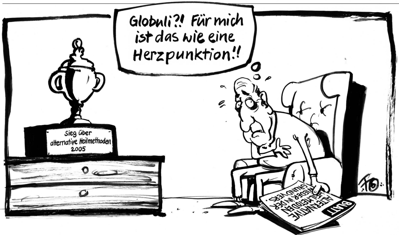
Im Jahr 2005 kippte Pascal Couchepin die Komplementärmedizin aus der Grundversicherung. Sein Nachfolger Didier Burkhalter hat den Entscheid nun – einstweilen – revidiert.