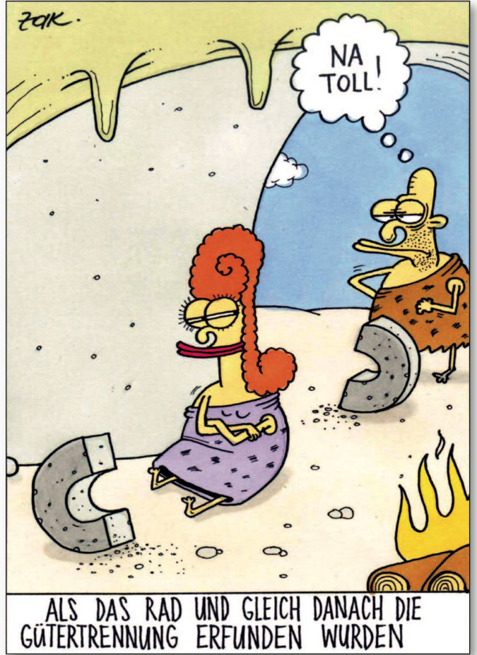
ALS DAS RAD UND GLEICH DANACH DIE GÜTERTRENNUNG ERFUNDEN WURDEN