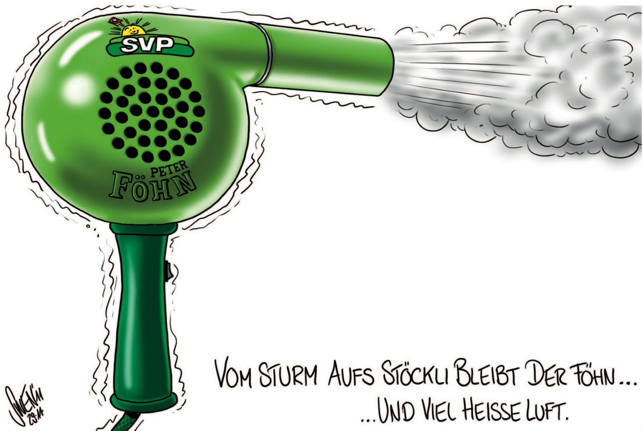
SWEN (SILVAN WEGMANN)

lich, was heute nicht mehr allzu oft vorkommt, äusserst liquide sein. (rs)