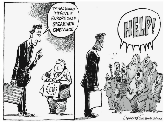
Patrick Chappatte, International Herald Tribune «Vieles würde einfacher, wenn Europa mit einer Stimme spräche.»