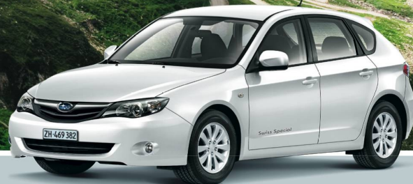
Impreza 1.5R AWD Swiss Special, 5-türig, 107 PS, man, Fr. 27'000.-