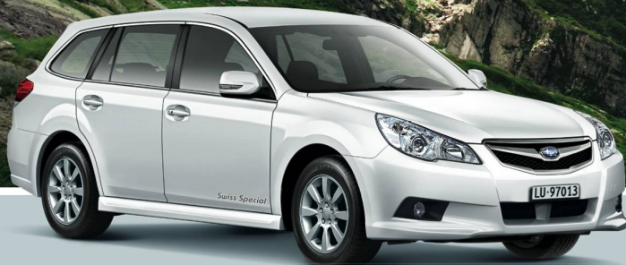
Legacy 2.0i AWD Swiss Special, 5-türig, 150 PS, man., Fr. 33'650.-