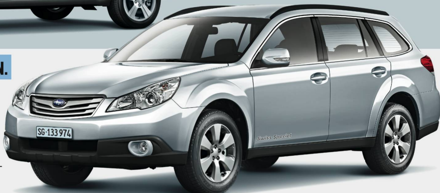
Outback 2.5i AWD Swiss Special, 5-türig, 167 PS, man., Promotionspreis: Fr. 39'850.-