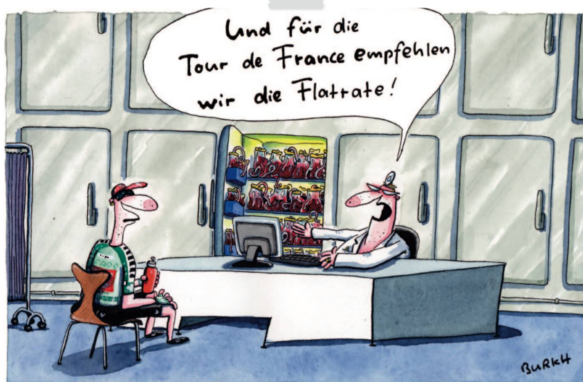
Blutdopingpapst Dr. Fuentes