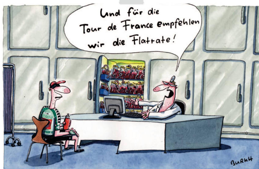
Blutdopingpapst Dr. Fuentes