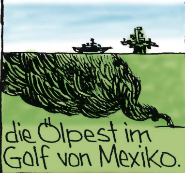
die Ölpest im Golf von Mexiko.

Rauchende Vulkane, Tsunamis oder Erdbeben und dergleichen stören erheblich das Geschäft. Hinzu kommen Eigenverschulden wie