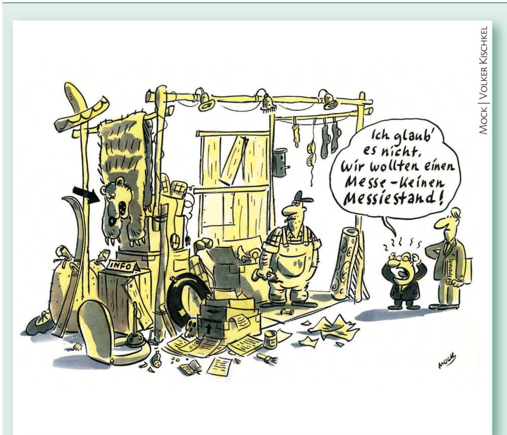
MOCK | VOLKER KISCHKEL