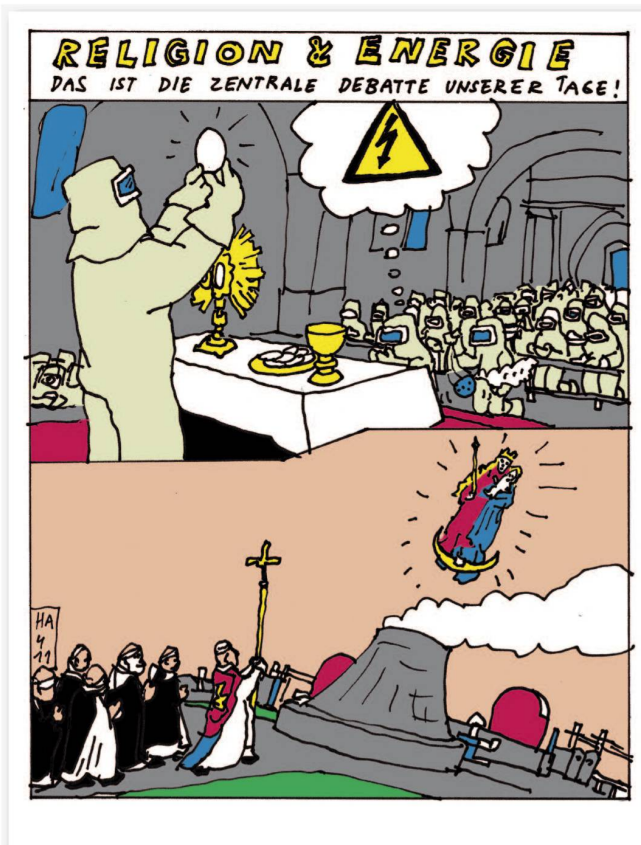
Da wie dort: Furcht und Faszination des Unsichtbaren