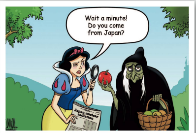
Luojie | China Daily Moment mal, kommst du aus Japan?