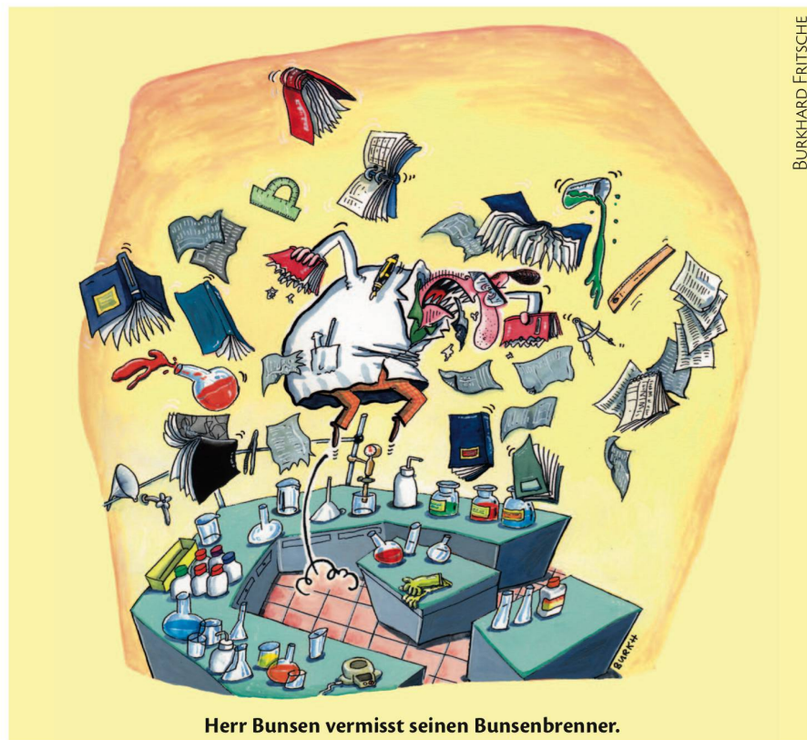
Herr Bunsen vermisst seinen Bunsenbrenner.