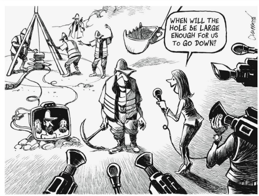
Patrick Chappatte International Herald Tribune