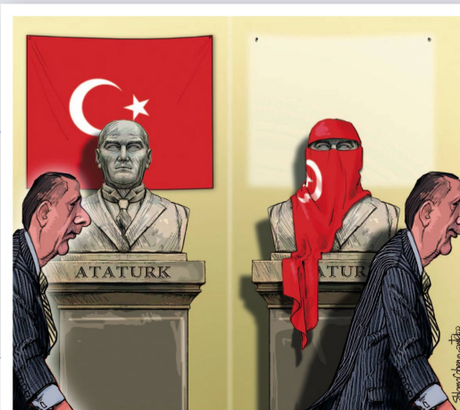
Nebelspäter Nr. 14 | 2010