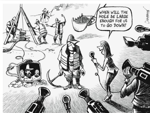
Patrick Chappatte International Herald Tribune