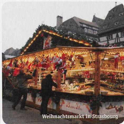
Weihnachtsmarkt in Strasbourg

Gleiche Reise in umgekehrter Reihenfolge.