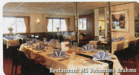
Restaurant MS Johannes Brahms

Auf diesem sehr komfortablen Schiff finden max. 80 Personen in 40 Kabinen Platz. Alle Kabinen liegen aussen, sind mit grossen Panoramafenstern, zwei unteren Betten, Dusche/WC, Fön, Telefon, TV, Minibar, Safe und Klimaanlage ausgestattet. Zur Bordausstattung gehören Restaurant, grosszügige Lounge und Sonnendeck. Nichtraucherschiff (Rauchen auf dem Sonnendeck erlaubt).