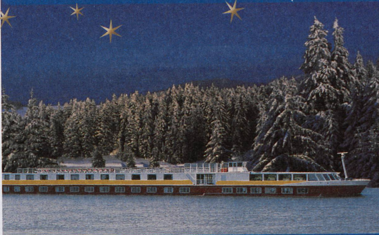
MS Johannes Brahms****