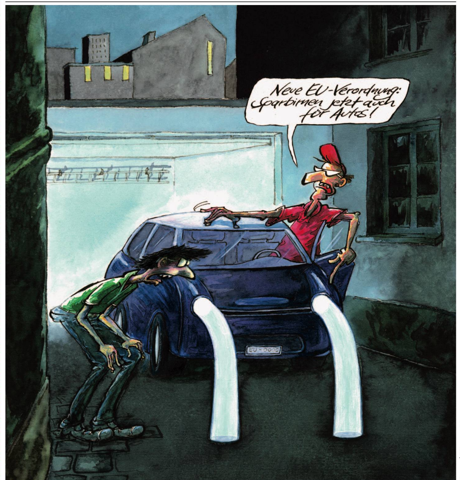
SOBE | PETER ZIMMER