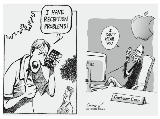
Patrick Chappatte International Herald Tribune Empfangsprobleme bei Apples neuem iPhone