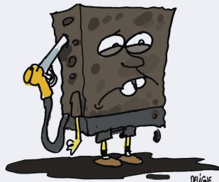
Frederick Deligne Nice-Matin, Frankreich Spongebob Ölschwamm mit Rekord-Quartalsverlust.