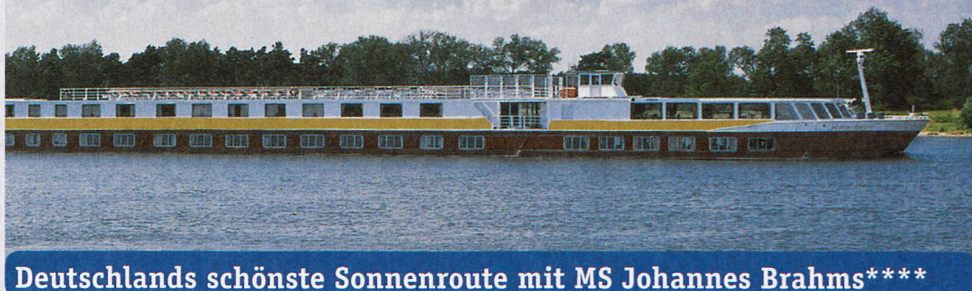
Deutschlands schönste Sonnenroute mit MS Johannes Brahms****

Rabatt Fr. 500.- p.P. = Fr. 1000.- Rabatt für 2 Personen