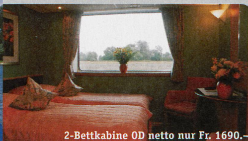
2-Bettkabine OD netto nur Fr. 1690.-