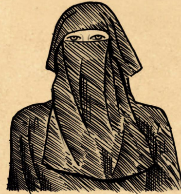
3 – Niqab Sehschlitz erlaubt, v.a. in AG, AR VD, JU, FR, NE, SG