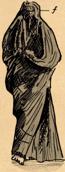
1 – Burka