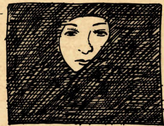
6 – Tschador in liberalen Ktn. toleriert, v.a. BE, BS, ZH, AG, SH