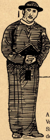
A = vermutl. Vorläufer des Sichtfensters der Burka