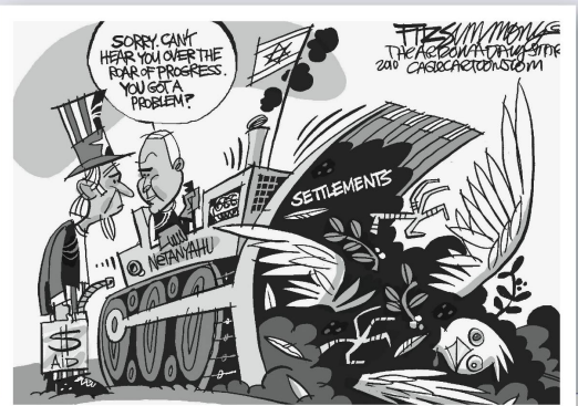
David Fitzsimmons, The Arizona Star

«Sorry, ich verstehe nichts bei diesem Bau- stellenlärm.»