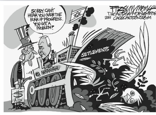
David Fitzsimmons, The Arizona Star

«Sorry, ich verstehe nichts bei diesem Bau- stellenlärm.»