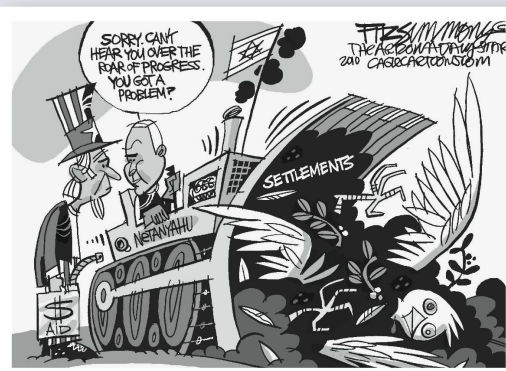
David Fitzsimmons, The Arizona Star

«Sorry, ich verstehe nichts bei diesem Bau- stellenlärm.»