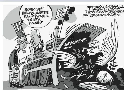
David Fitzsimmons, The Arizona Star

«Sorry, ich verstehe nichts bei diesem Bau- stellenlärm.»