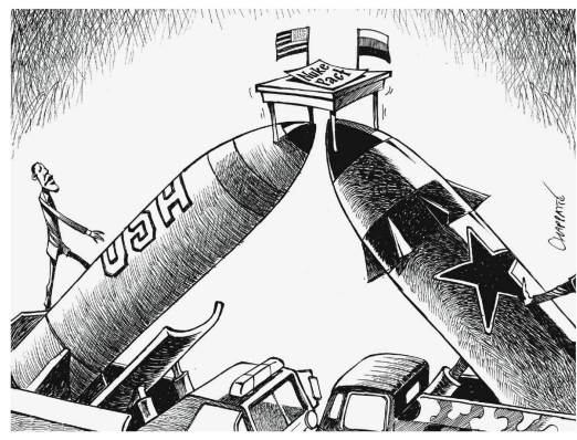
Patrick Chappatte, International Herald Tribune