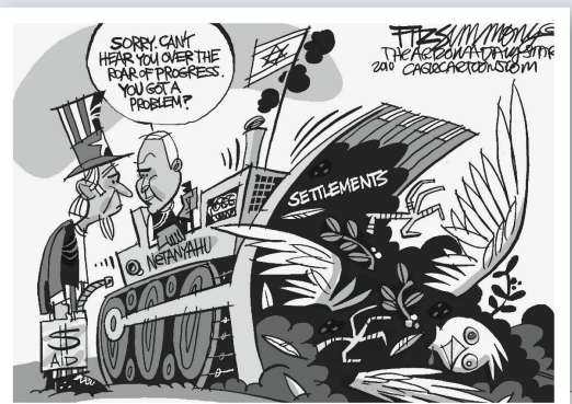
David Fitzsimmons, The Arizona Star

«Sorry, ich verstehe nichts bei diesem Bau- stellenlärm.»